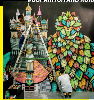
#SUPAKITCH AND KORALIE