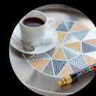
RU ELLER PORØSE METALLER